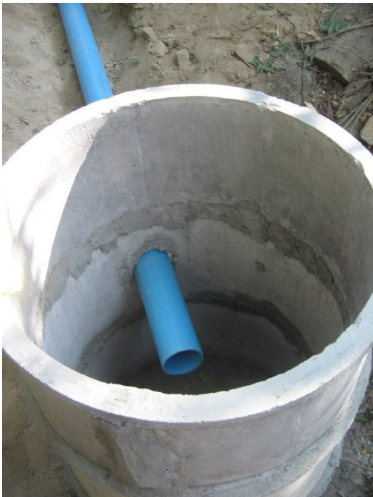
รูปที่ 3: ถังตกตะกอน