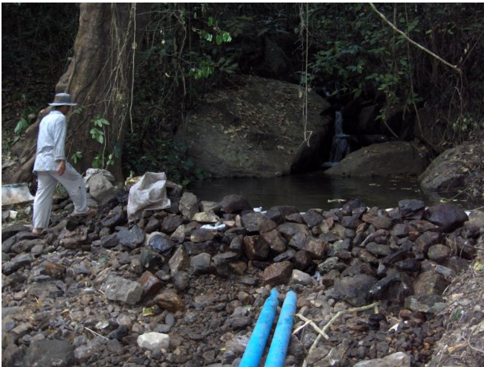
รูปที่ 8: สร้างเขื่อนเสร็จ ความสูงของเขื่อนเพียงพอที่จะให้ท่อน้ำไหลเข้า จมพอดี้