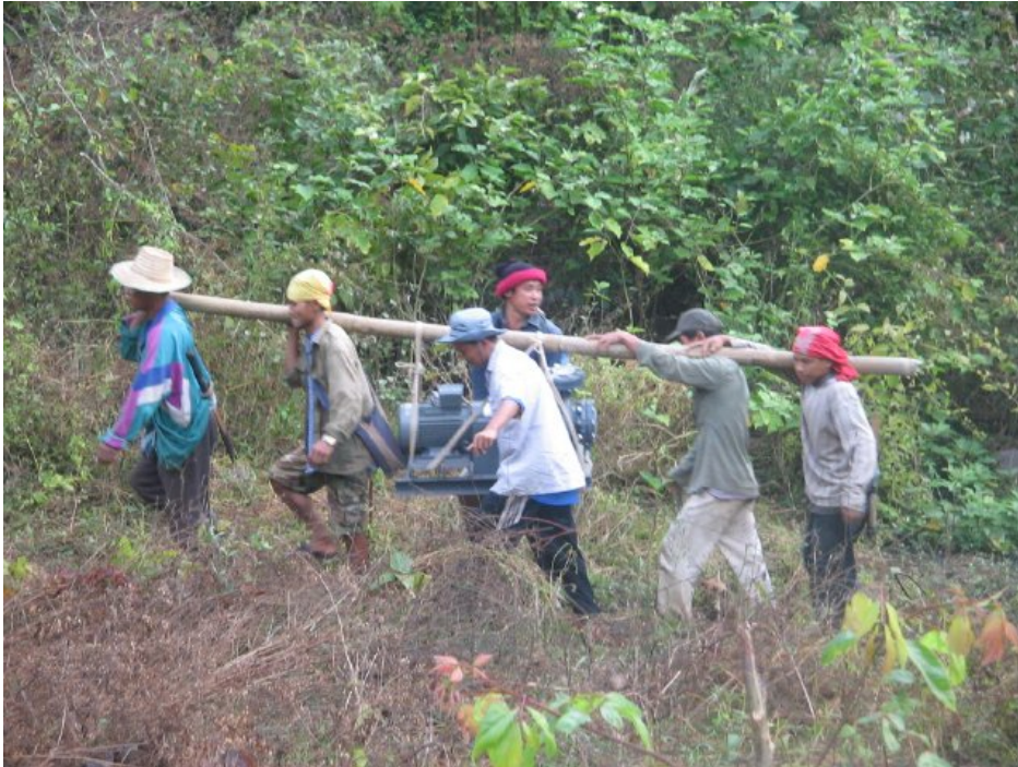
รูปที่ 4: ชาวบ้านช่วยกันยกกังหันปั่นไฟ/เครื่องผลิตกระแสไฟฟ้าที่หนักมากกว่า 100 กิโลกรัม เป็นระยะทางประมาณ 0.6 กิโลเมตร ไปยังบริเวณติดตั้ง