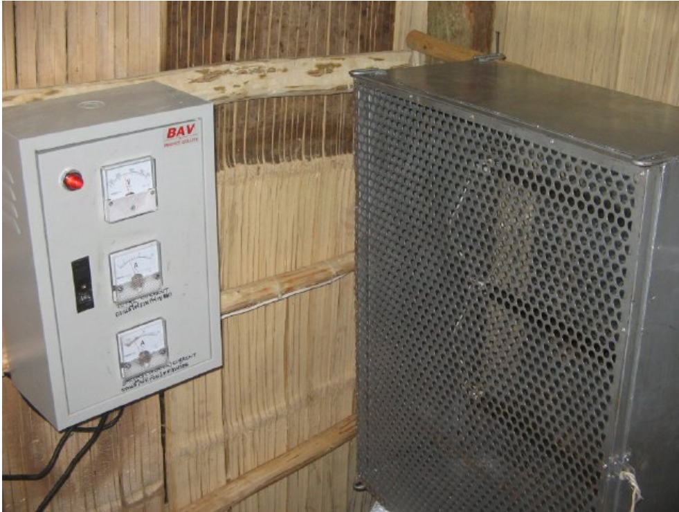
รูปที่ 15: ตัวควบคุมโหลดแบบอิเล็กทรอนิกส์ และตัวต้านทานขดลวดในตะแกรงโลหะ