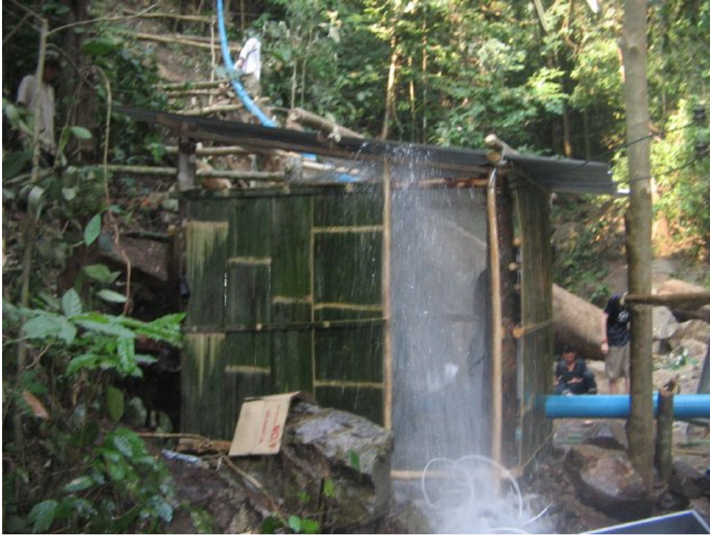
รูปที่ 12: การสื่อสารที่ผิดพลาด และการต่อท่อที่ไม่แข็งแรง เกือบทำให้เกิดความเสียหายของท่อใน powerhouse อุปกรณ์อิเล็กทรอนิกส์ทุกชิ้นเปียก แต่ไม่เกิดความเสียหายใด ๆ