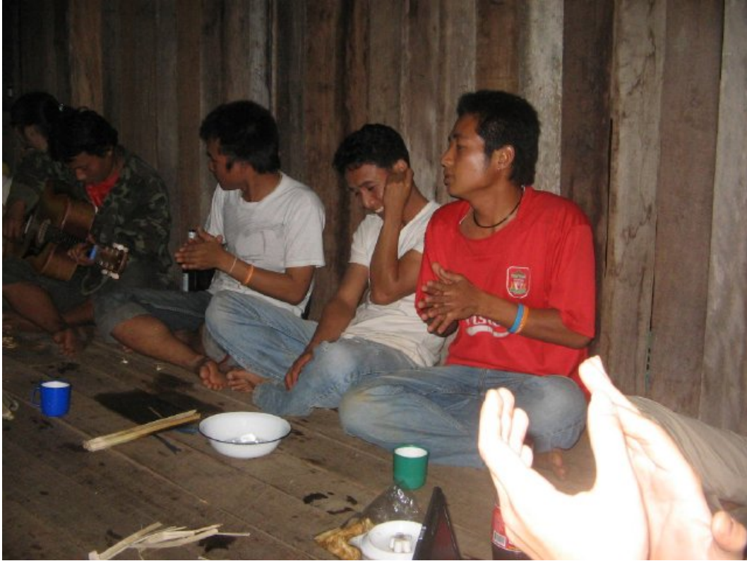
รูปที่ 18: งานฉลองในคืนสุดท้ายของการติดตั้ง