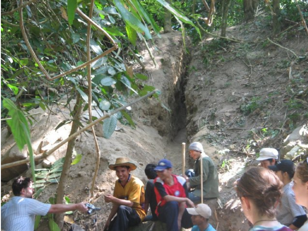
รูปที่ 2: ช่องทางเดินของท่อน้ำ หลังจากผ่านถึงตกตะกอน มีความยาวถึง 20 เมตร